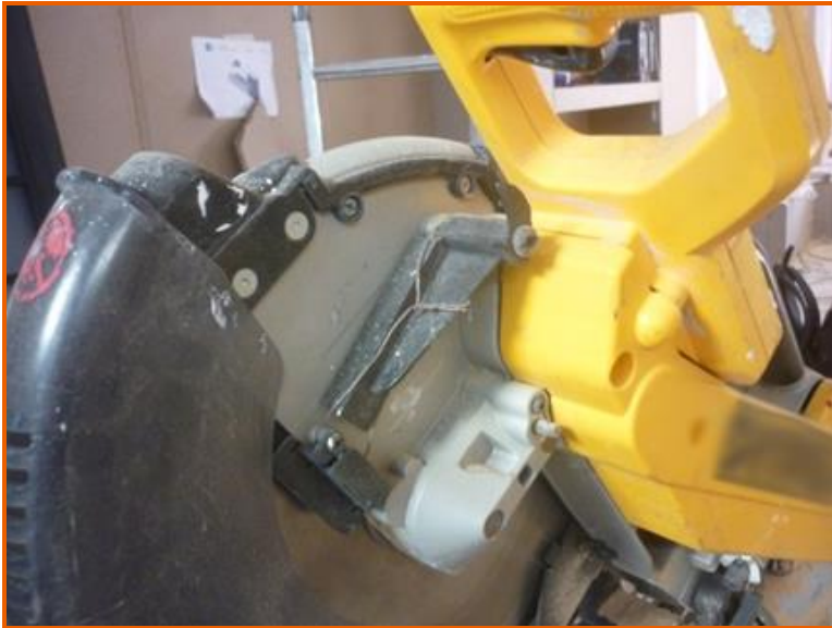
Figura 4: riparazione sulla cuffia di protezione della troncatrice eseguita con fil di ferro.

Il supporto della presa, in cui era inserita la spina di alimentazione della troncatrice era fuori dalla scatola di derivazione a muro con cavi elettrici a vista, in condizioni tali da costituire rischi di contatti elettrici diretti durante l'inserimento/estrazione della spina nella/dalla presa (Figura 5).