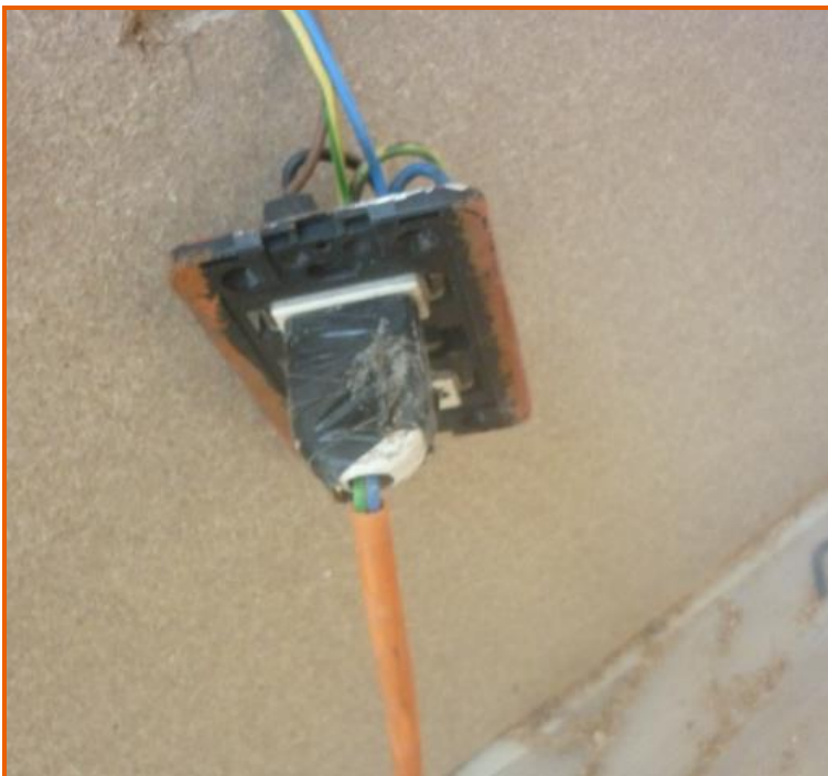
Figura 5: spina di alimentazione nastrata con nastro isolante; il supporto della presa era fuori dalla scatola di derivazione a muro con cavi elettrici a vista.

Il supporto della presa, in cui era inserita la spina di alimentazione della troncatrice era fuori dalla scatola di derivazione a muro con cavi elettrici a vista, in condizioni tali da costituire rischi di contatti elettrici diretti durante l'inserimento/estrazione della spina nella/dalla presa (Figura 5).