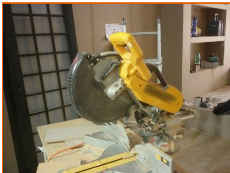
Figura 1: troncatrice con marcatura CE, utilizzata da Marco

Marco stava eseguendo il posizionamento di listelli in laminato per la realizzazione della pavimentazione dello spazio espositivo. Per compiere queste operazioni utilizzava la troncatrice di proprietà della ditta EMPO per eseguire il taglio su misura di listelli di legno laminati da posizionare a pavimento (figura 1).