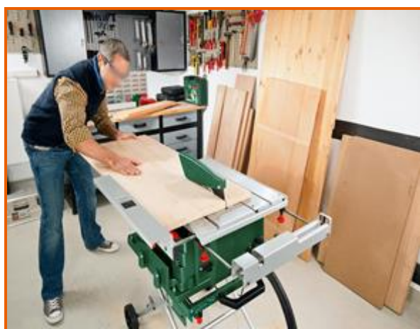
Esempio d'uso di una sega circolare da banco

Per l'esecuzione di quel tipo di taglio sul listello, inoltre, sarebbe stato più appropriato utilizzare una sega circolare da banco anziché una troncatrice, poiché questa attrezzatura essendo provvista di lama fissa sul banco, di guida laterale, per la regolazione della superficie da tagliare, avrebbe consentito il taglio in sicurezza del listello per tutta la sua lunghezza, con l'ausilio di uno spingi pezzi, considerate le dimensioni del listello stesso.