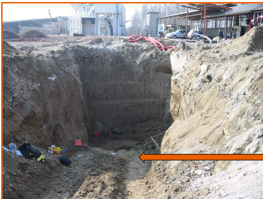
Tracce dei cingoli dell'escavatore