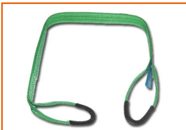
Esempio di braca utilizzata in edilizia per il trasferimento dei materiali