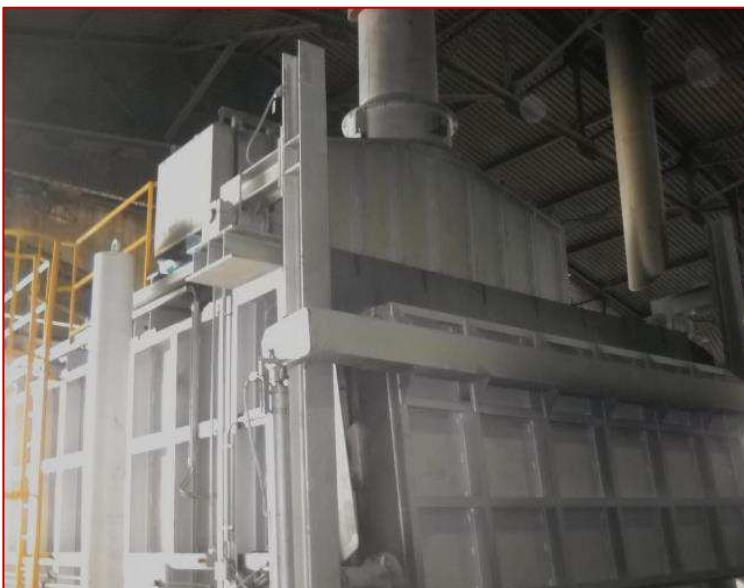
Figura 2. Vista del forno fusorio al termine dei lavori di costruzione.

"Sul tetto del forno correvano, perpendicolarmente alla bocca di carico, delle travi in acciaio poste a circa 70 cm dalla volta in precedenza realizzata. Sopra la volta doveva essere sistemato l'isolamento e poi, a completamento, la gettata con cemento C50. Durante la gettata io stavo in equilibrio con i piedi su due travi che distavano tra loro circa 50 cm."