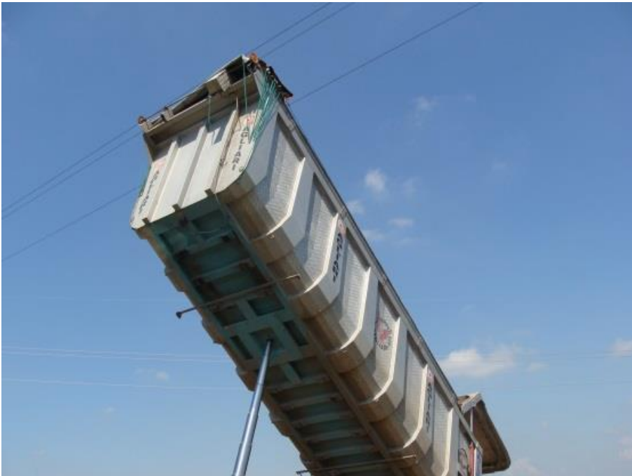
Figura 2: particolare della sommità del ribaltabile a contatto con la linea elettrica da 15 kV.