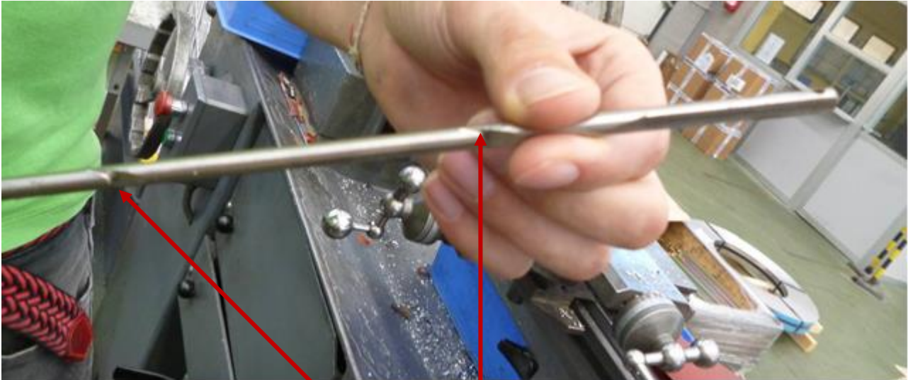
Punti che dovevano essere sbavati