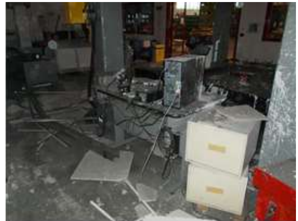
Figura 5: Scrivania del Signor Marrone