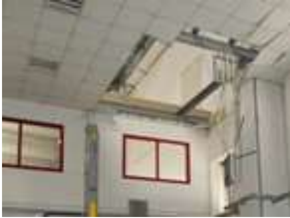
Figura 2: Controsoffittatura del locale “uffici” da cui è precipitato il lavoratore