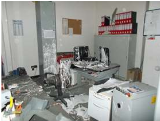
Figura 4: Area di lavoro di Signor Marrone