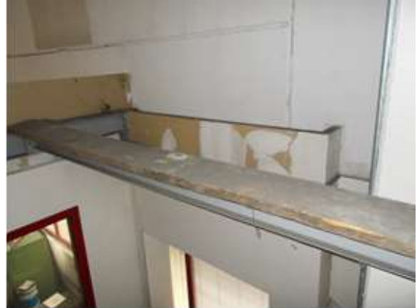
Figura 3: Asse da ponte appoggiata sulla putrella