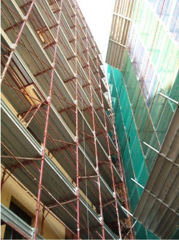
Figura 1: edifici con i ponteggi