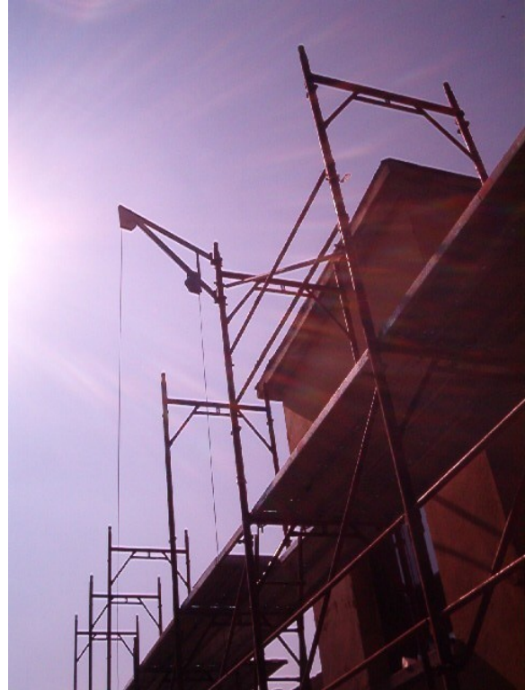
Figura 2: carrucola dell'argano