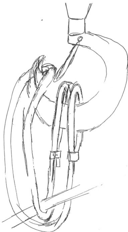
Figura 4: gancio con imbracatura a tre spire

Inoltre, la fune utilizzata per imbracare i cavalletti è tale che deve essere agganciata in tre spire, invece di due, determinando un eccessivo riempimento del gancio con difficoltà di chiusura del sistema di sicurezza e facile scivolamento della corda con apertura dell'anello che tiene imbracato il carico (figura 4 e 5). Ed è proprio lo scivolamento provocato dalle oscillazioni del carico a determinare la caduta dei cavalletti.