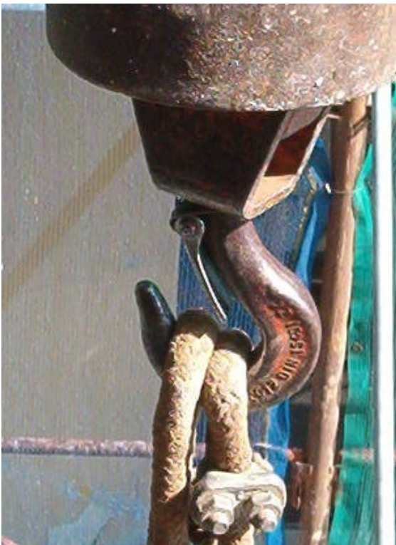
Figura 3: gancio con la molla di chiusura difettosa

“Tutte le mattine noi controlliamo che il gancio e la chiusura del gancio siano a posto. In caso di difetto ne chiediamo uno di ricambio al nostro magazzino. In questi giorni e anche questa mattina, l’argano e il gancio risultavano a posto”.