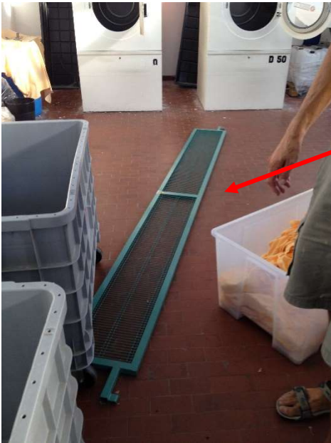
Foto 3: Evidenziato dalla freccia il riparo fisso rimosso per agevolare le operazioni di soccorso.