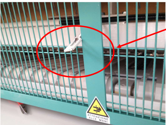
Foto 5: in evidenza il sistema di fissaggio della protezione fissa munito alla sua estremità di un dado a farfalla che per conformazione, mediante una semplice rotazione manuale di 90 gradi, consente il sollevamento della grata di protezione.