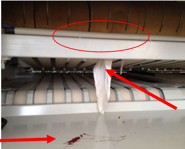
Foto 2: vengono evidenziate dall'alto in basso: il punto di intrappolamento, il capo rimasto impigliato e alcune tracce ematiche.

Come un fiume in piena continuò il suo racconto: - Il mangano essiccante non possiamo fermarlo in quanto potrebbe addirittura incendiarsi per surriscaldamento. Anche premendo i pulsanti di emergenza, i rulli pressori, che hanno una temperatura superiore ai 100 gradi, continuano a girare per diverso tempo sino a raffreddamento avvenuto -