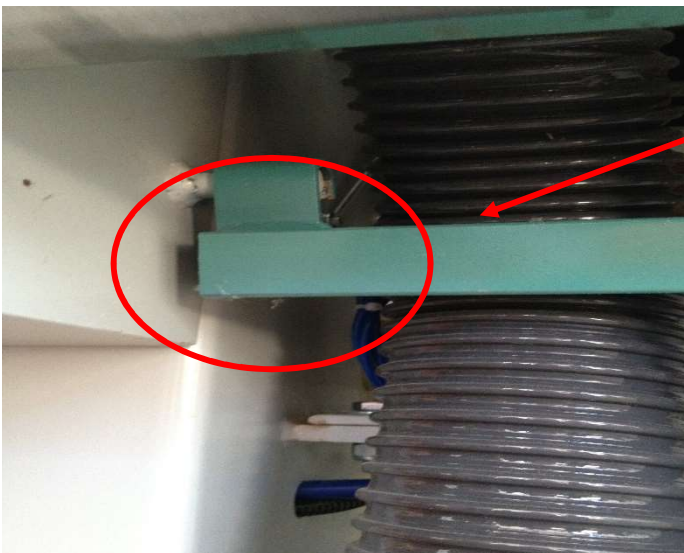
Foto 4: In evidenza uno dei due cardini per mezzo dei quali il riparo fisso di colore verde può essere alzato rimanendo incernierato alle due estremità.