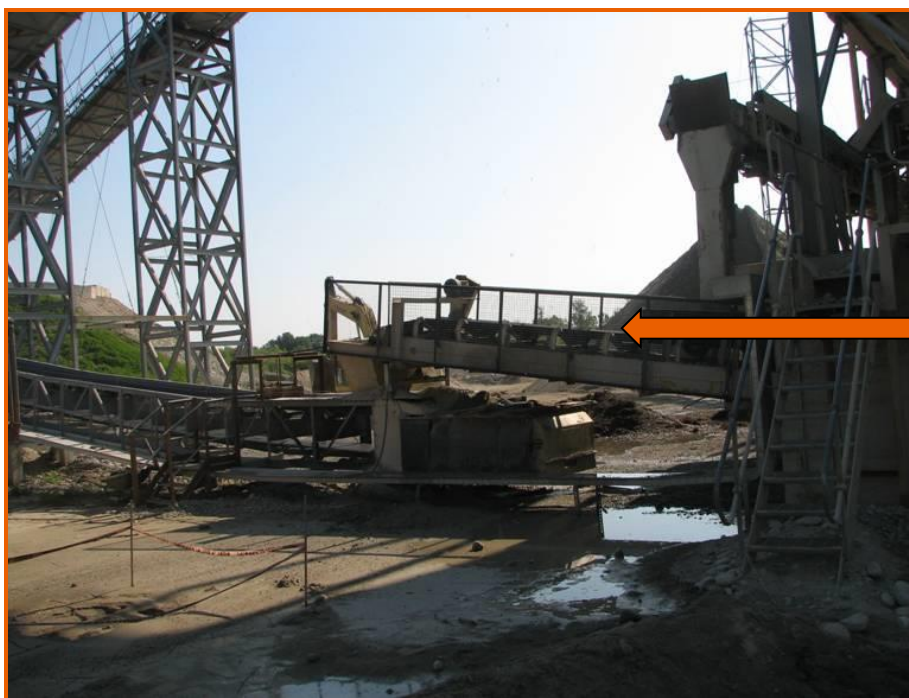
Nastro trasportatore protetto con parapetti

Anche altri nastri trasportatori accessibili ai lavoratori sono stati protetti con parapetti.