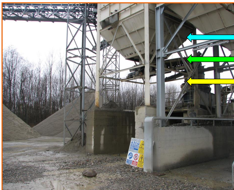
Nastro trasportatore (verde) che convoglia gli inerti dalla tramoggia (azzurra) al mulino di frantumazione

L'impianto di trasformazione annesso alla cava è costituito da tramogge, frantoi, mulini e vagli collegati da nastri trasportatori, con relativi organi di movimento (motori, cinghie e catene di trasmissione, pulegge, volani, molle di richiamo, ecc.), che portano i materiali ai diversi punti dell'installazione e, alla fine, consentono di caricare il materiale trattato sugli automezzi da trasporto.