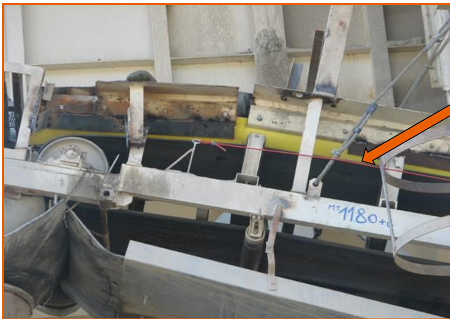
Interruttore d'arresto di emergenza a cavo flessibile

Anche altri nastri trasportatori accessibili ai lavoratori sono stati protetti con parapetti.