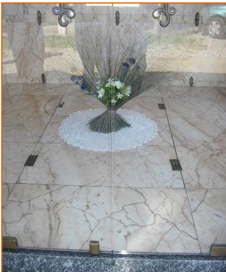
Copertura di una botola di un'edicola funeraria simile a quella dell'infortunio

Nel caso in esame le tre lastre rettangolari di copertura della botola, costituite a loro volta da due lastre in travertino e marmo, sono state sottoposte a un eccessivo carico a flessione in quanto poggiavano unicamente sulle due estremità, i cui spigoli erano appoggiati su uno "spessore" o "rialzo" (vedi schema seguente).