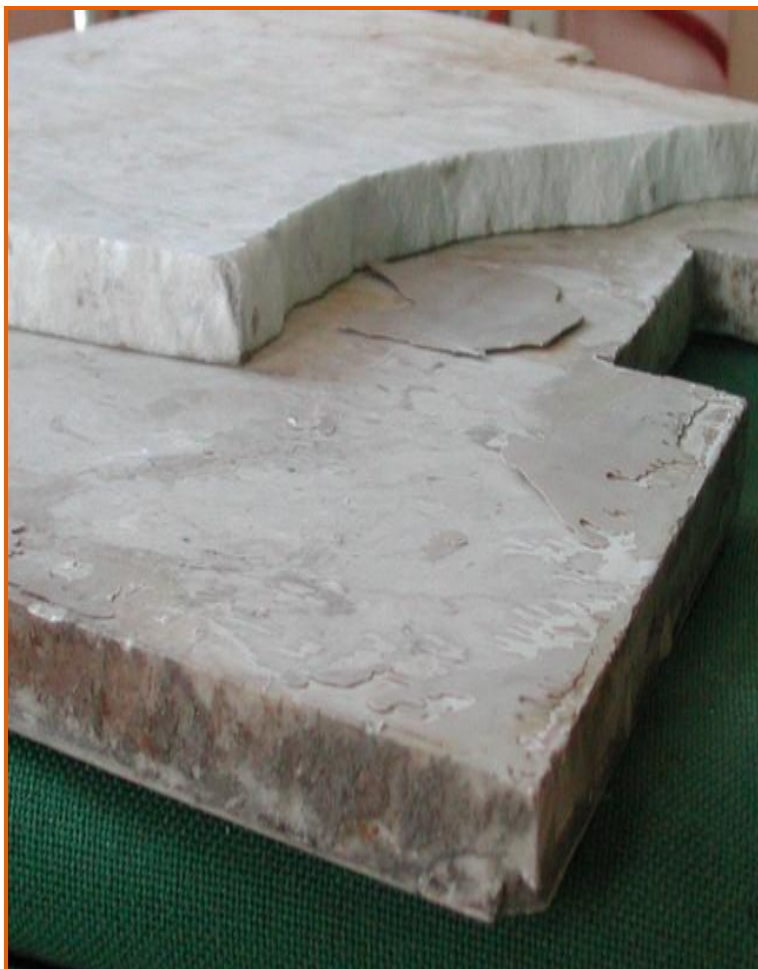
Lastre di travertino e marmo sovrapposte, utilizzate per la copertura della botola dell'edicola funeraria