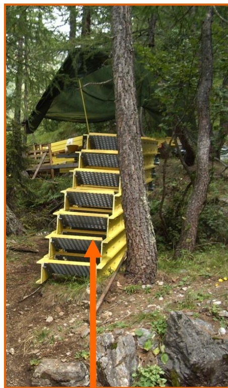
Elementi della scala di servizio da montare all'interno della galleria