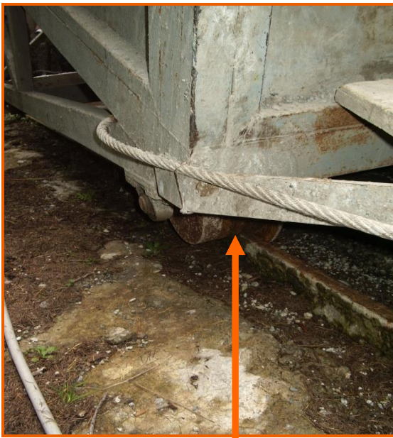
Particolare delle ruote del carrello che poggiano su una rotaia con profilo inadeguato in relazione alla distanza ruota – terreno, così da favorire il possibile deragliamento