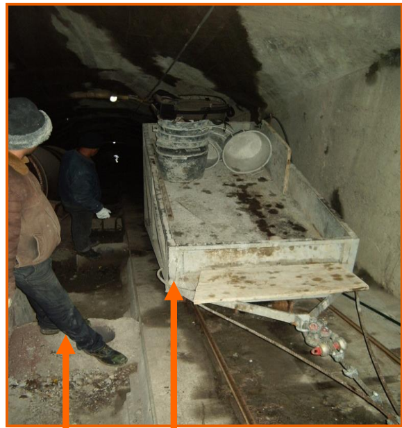
Percorso riservato ai lavoratori