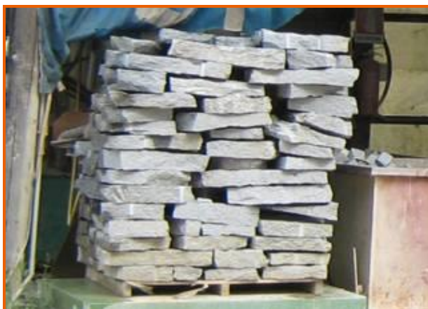
Bancale di pietre ancora da spaccare per la realizzazione di cubetti

Durante i lavori per la realizzazione di cubetti in pietra, un operaio ha subito una ferita da schiacciamento alla mano destra riportando un'invalidità permanente del 46%.