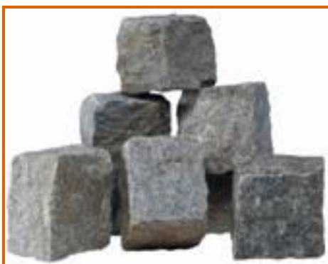
Cubetti al termine della lavorazione

Conosce pochissime parole di Italiano, ma il lavoro che svolge, di tipo manuale e perlopiù individuale, non prevede grossi scambi con colleghi e superiori e non necessita quindi di un vocabolario molto articolato. Inoltre, il rumore assordante e la diversa provenienza dei lavoratori (Marocco e Cina) complicano ulteriormente la comunicazione durante le ore di lavoro.