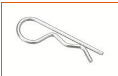
Esempio di coppiglia di fissaggio