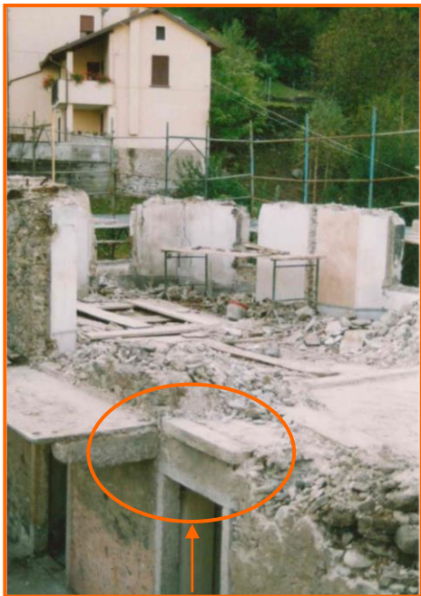
Edificio in demolizione: zona dove si trovava l'infortunato prima della caduta

L'infortunio si è verificato nel 2002, nel primo pomeriggio di una giornata di fine settembre, presso un cantiere edile situato in pianura.