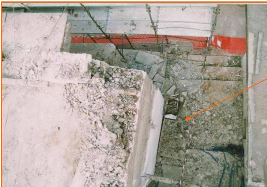
Vista dall'alto delle macerie del balcone caduto

Ambrogio, si è infortunato a seguito di una caduta da un'altezza di circa 6 metri.