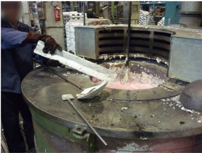
Simulazione inserimento lingotti nel forno