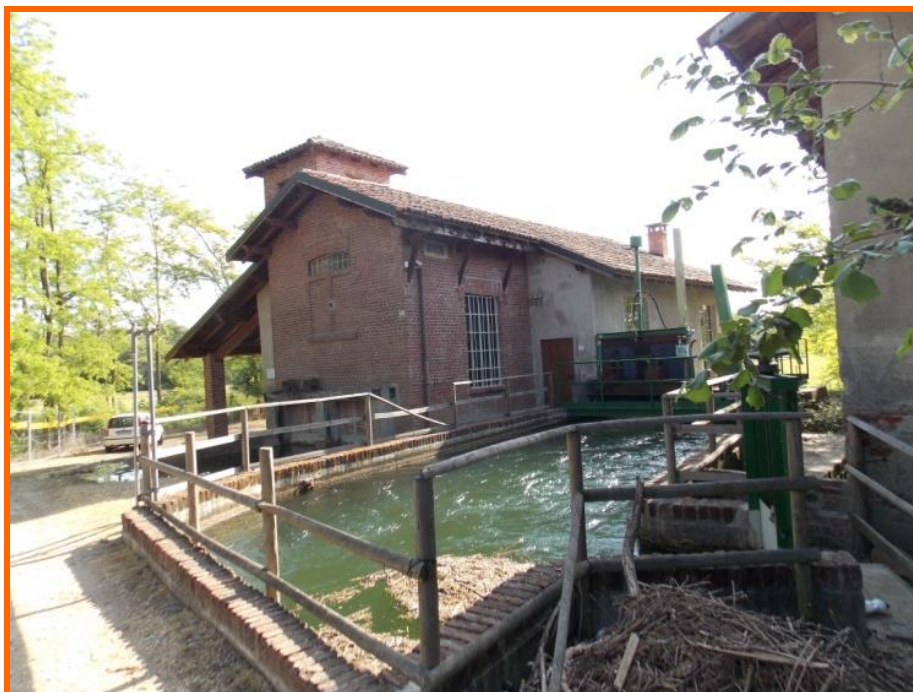
Figura 1: Mulino in cui era stata ricavata la centrale idroelettrica

L'infortunio è avvenuto nell'autunno del 2013, in tarda mattinata verso le undici e mezza nei pressi di un edificio, un vecchio mulino, all'interno di un parco dove è stata realizzata una centrale idroelettrica che sfrutta il salto d'acqua presente in un canale irriguo (figura 1).