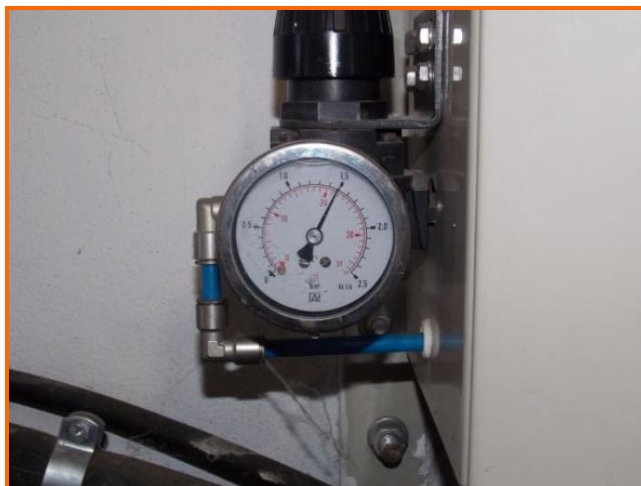
Figura 4: Dettaglio del manometro (indica 1,5 bar)

Sicuramente Achille ha avuto un comportamento superficiale nel controllare la pressione della turbina probabilmente anche a causa della perfetta conoscenza dell'impianto che lui stesso aveva realizzato.