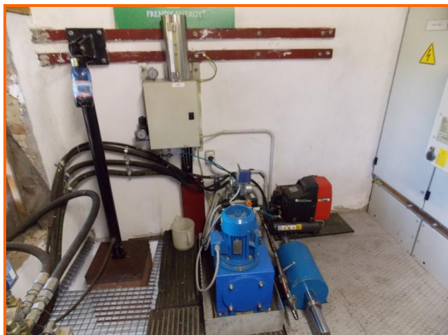
Figura 3: Sala controllo con sistema di pressurizzazione dell'impianto a turbina