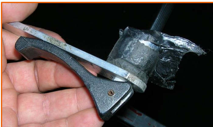
Dispositivo di sicurezza a tampone contro l'apertura della scala, usurato e manomesso con del nastro isolante al fine di ripristinarne inutilmente il funzionamento

"Appena tocco la scala la sento cedere, si è aperta ed è caduta su sé stessa".