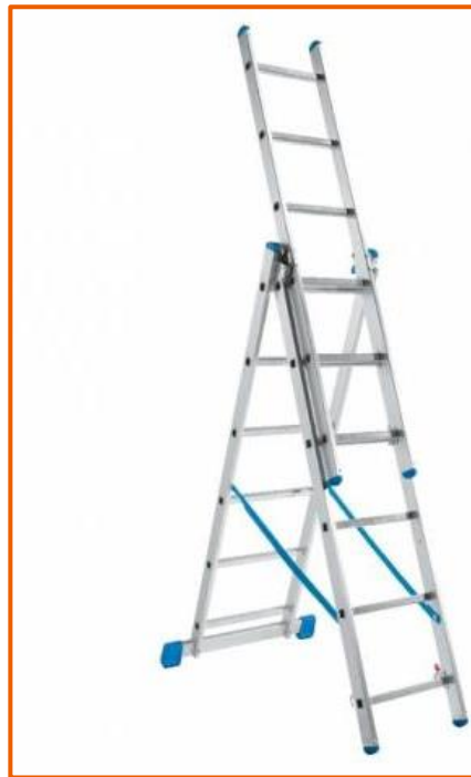
Scala tipo doppia ad innesto