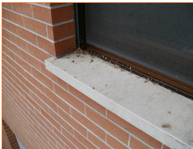
Figura 1: davanzale della finestra da cui si potevano vedere numerose vespe

Dopo essere uscito sul balcone della cucina e aver guardato nella direzione della finestra del bagno (figura 1) si è diretto nel bagno per poter vedere nel vano della tapparella avvolgibile (figura 2). L'amministratore prima di intervenire aveva detto che se l'alveare si fosse trovato sulle pareti esterne del condominio se ne sarebbe occupato personalmente, altrimenti avrebbe contattato l'apposito servizio fornito dai volontari dell'Antincendio Boschivi. Munitosi di scaletta si è così avvicinato al cassone della tapparella per rimuoverne lo sportello.