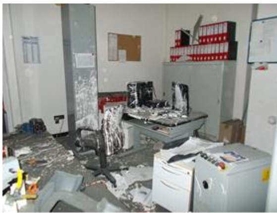
Figura 4: Area di lavoro del Signor Marrone