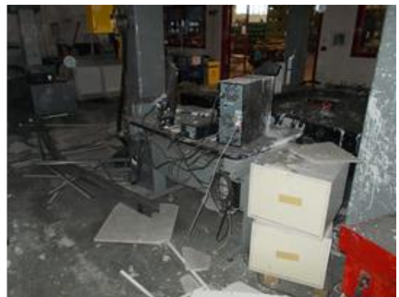
Figura 5: Scrivania del Signor Marrone