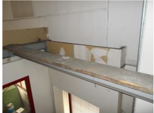
Figura 3: Asse da ponte appoggiata sulla putrella