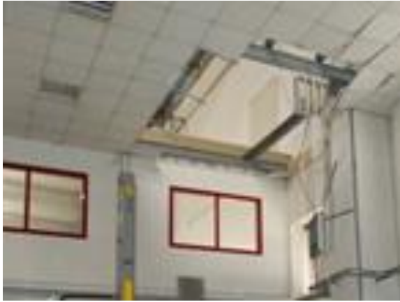
Figura 2: Controsoffittatura del locale “uffici” da cui è precipitato il lavoratore