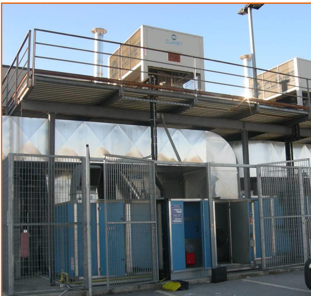
Unità Trattamento Aria

L' U.T.A. interessata dai fatti ha una portata dell'aria pari a 27.000 m 3 /h. La potenza termica è di 203 kW e quella frigorifera di 170 kW. È disponibile una seconda Unità Trattamento Aria uguale alla prima ma è da tempo inutilizzata.