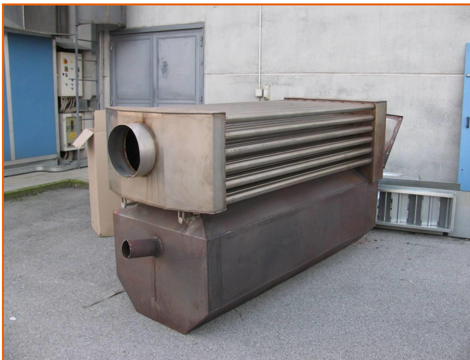
Scambiatore di calore

L'unità è composta da un locale tecnico costituito da pannelli in poliuretano rivestiti internamente da lamiera zincata ed esternamente da lamiera plastifica. All'interno del locale è presente uno scambiatore di calore in acciaio inox costituito da una camera di combustione sulla cui sommità è presente un fascio tubiero. La camera di combustione è collegata a un bruciatore alimentato da gas metano. Per effetto della fiamma generata dalla combustione del gas metano e dei fumi di combustione che circolano nel fascio tubiero, si scalda il metallo e di conseguenza l'aria del locale tecnico. Un ventilatore sempre posto nel locale tecnico, fa sì che l'aria calda, filtrata e miscelata con una percentuale di aria presa dall'esterno, raggiunga i locali attraverso alcune condotte. All'interno dei locali vi sono delle "riprese", ossia tubazioni che prelevano l'aria dai locali e la convogliano all'interno del locale tecnico per la rimessa in circolo.