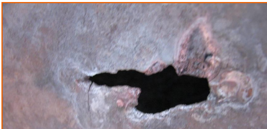
Fessure generate nelle lamiere

Nel corso dei sopralluoghi sono state rilevate due fessure , di modesta entità, nella parte anteriore destra e una terza più importante , posta nella parte inferiore della parete opposta al bruciatore, avente lunghezza totale pari a 20 cm e altezza di pochi mm per metà della lunghezza e circa 3 cm per la restante parte.