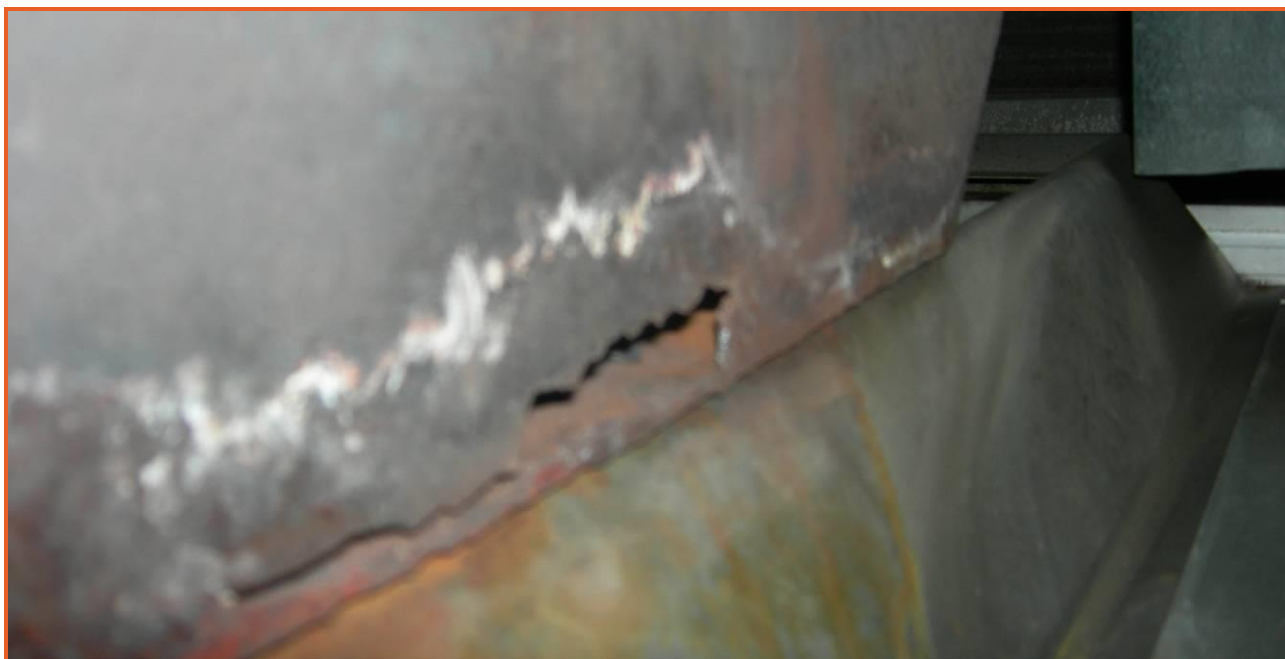
Fessure generate nelle lamiere

Da queste aperture, specie la più grande delle tre, sono fuoriusciti i fumi di combustione e conseguentemente il monossido di carbonio che è stato immesso nei locali commerciali attraverso l'impianto di ventilazione.