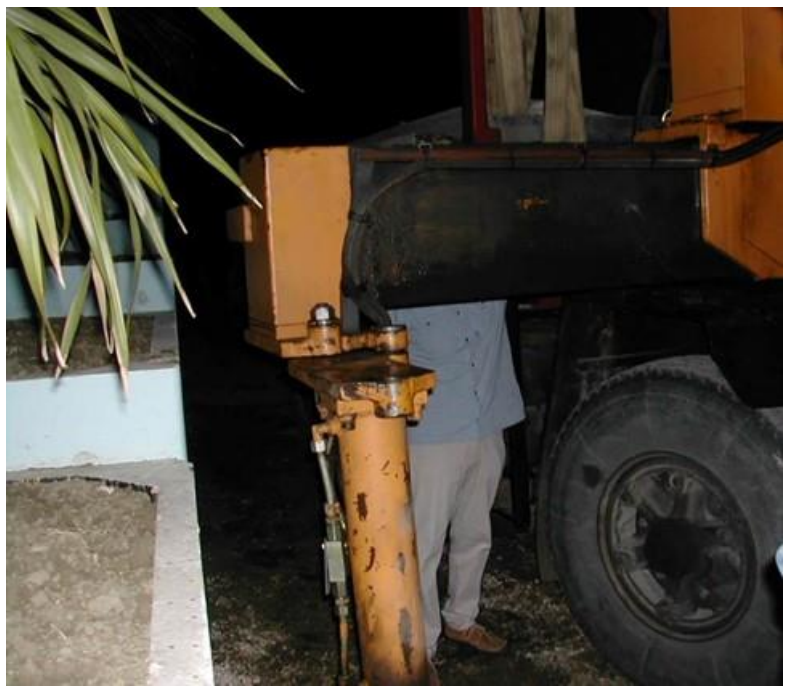
Figura 3. Autogrù con stabilizzatore aperto