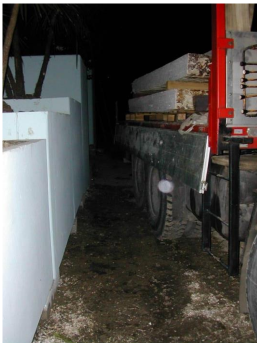
Figura 2. Autogrù con stabilizzatore chiuso