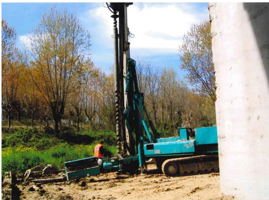
Figura 3. Macchina palificatrice/perforatrice