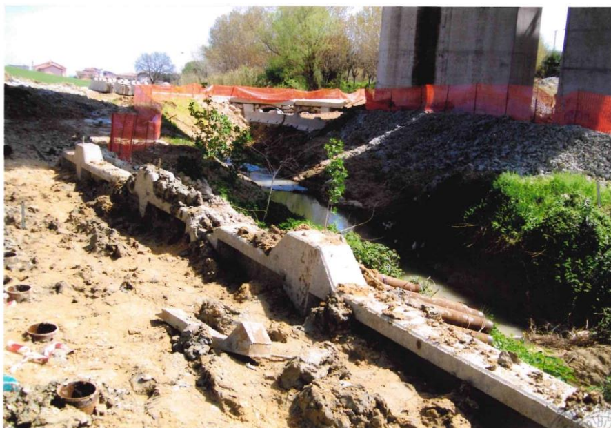
Figura 1. Area di cantiere con basi di micropali

Erano i primi giorni di primavera, una mattina del mese di aprile, come sempre il lavoro era iniziato presto; in tutta l'area di cantiere era presente molto fango, anche le attrezzature erano infangate, soprattutto a causa della dispersione della "boiaccia" usata durante le perforazioni. Il cantiere era espressamente dotato di un "impianto fango" per produrre, in loco, le grandi quantità di boiaccia necessarie per le trivellazioni.