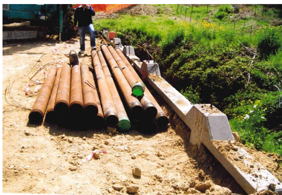
Figura 4. Spezzoni di tubi metallici che vanno a costituire l'armatura dei micropali

Il Pronto Soccorso ospedaliero ha certificato un trauma del rachide cervico-dorso-lombare con frattura della limitante somatica superiore di D12, da cui derivava una malattia e incapacità di attendere alle proprie occupazioni con prognosi iniziale di 45 giorni. L'infortunio dava luogo a invalidità permanente.