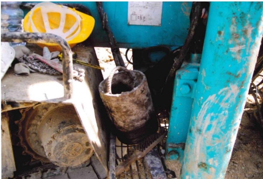
Figura 5. Testina di sollevamento “artigianale”