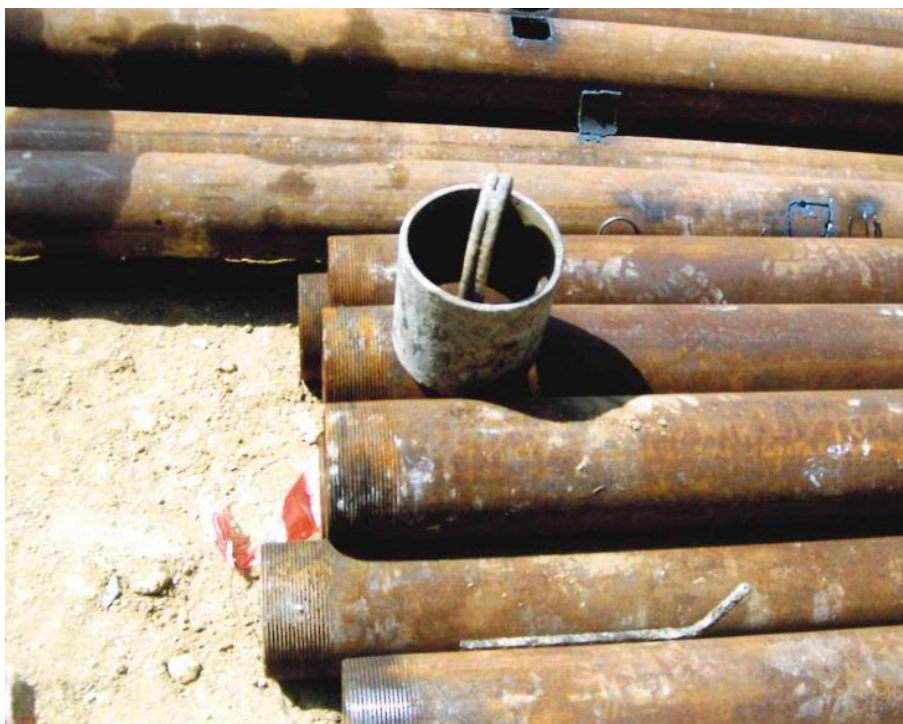
Figura 2. Testina di sollevamento “artigianale”

Riccardo descrive così la situazione immediatamente antecedente all’incidento: