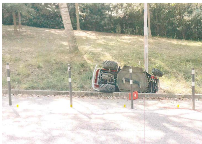
Figura 1. Luogo dell'infortunio

Contattato il collega, siamo arrivati sul luogo dell'infortunio dove erano già presenti i vigili urbani che avevano fatto i primi rilievi: si trattava di un'area verde in pendenza con prati e alberi. Mi ha colpito subito la macchia di sangue a terra, sul bordo della strada, vicino al trattorino, che era stato però spostato rispetto alla posizione originale (Figura 1).