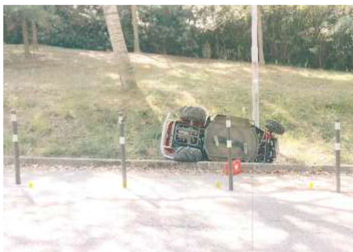
Figura 1. Luogo dell'infortunio

Contattato il collega, siamo arrivati sul luogo dell'infortunio dove erano già presenti i vigili urbani che avevano fatto i primi rilevati: si trattava di un'area verde in pendenza con prati e alberi. Mi ha colpito subito la macchia di sangue a terra, sul bordo della strada, vicino al trattorino, che era stato però spostato rispetto alla posizione originale (Figura 1).